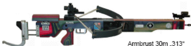
Armbrust 30m „313“