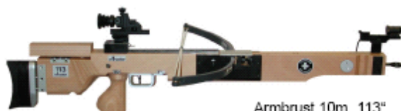
Armbrust 10m „113“